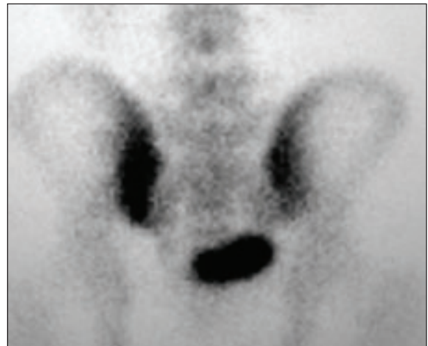
Figura 3. Hipercaptación gammagráfica con Tc99 en paciente con sacroilítis séptica por S. aureus (visión posterior)