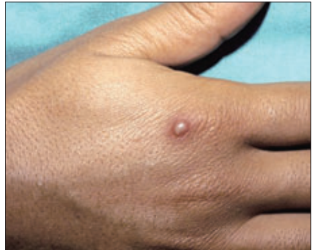
Figura 1. Pústula cutánea en paciente con artritis gonocócica.

La infección articular periférica tuberculosa es una artritis subaguda o crónica, que cursa con dolor y tumefacción articular, casi siempre en una sola articulación de carga. Es rara la aparición de fiebre y las manifestaciones sistémicas de infección, así como el eritema y el calor local. En los países industrializados la tuberculosis ósea suele ser consecuencia de una reactivación tardía de la infección y los pacientes no suelen presentar evi-